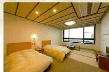
凜とした朝をむかえられるお部屋