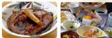
ご夕食にはもちろん「自慢の鯉甘露煮」付き♪